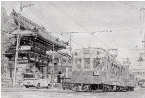
テツペイ「古豪、太秦広隆寺を通る」